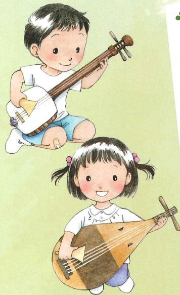
イラスト：しもかわら ゆみ