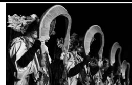
いとう 伊東わぞおぎ