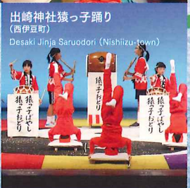
出崎神社猿っ子踊り (西伊豆町) Desaki Jinja Saruodori (Nishiizu-town)