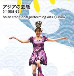
アジアの芸能 (中国雑技) Asian traditional performing arts (China)