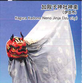
加殿子神社神楽 (伊豆市) Kagura Kadono Neno Jinja (Izu city)