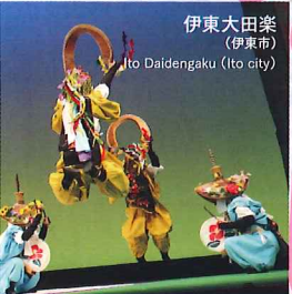
伊東大田楽 (伊東市) Ito Daidengaku (Ito city)