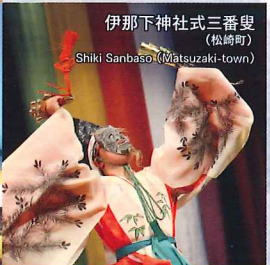
伊那下神社式三番叟 (松崎町) Shiki Sanbaso (Matsuzaki-town)