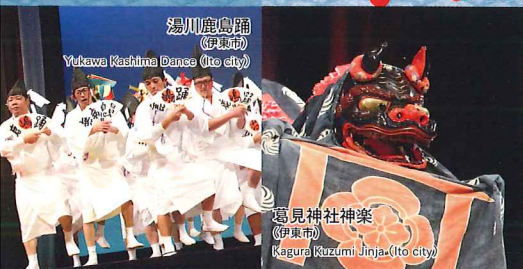
湯川鹿島踊 (伊東市) Yukawa Kashima Bonno (Ito city)

2017年より大田楽と 伊豆半島の郷土芸能が作ってきた祝祭に アジアの芸能(中国 韓国 インドネシア タイ)が加わりました。 静岡県の文化を世界へ向けて発信します。