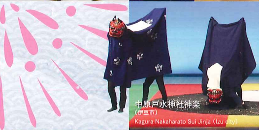
中原戸水神社神楽 (伊豆市) Kagura Nakaharato Sul Jinja (Izu city)