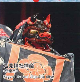
葛見神社神楽 (伊東市) Kagura Kuzumi Jinja (Ito city)