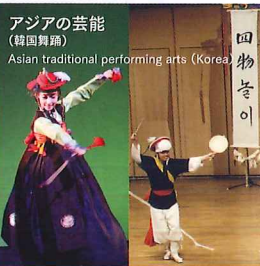
アジアの芸能 (韓国舞踊) Asian traditional performing arts (Korea)