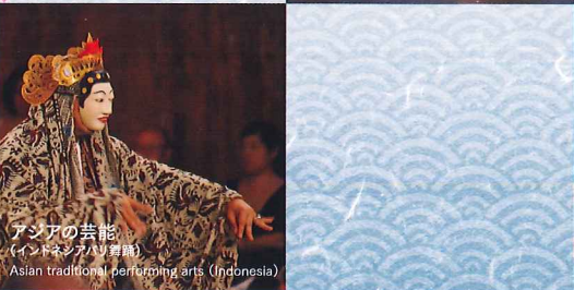
アジアの芸能 (インドネシアバリ舞踊) Asian traditional performing arts (Indonesia)