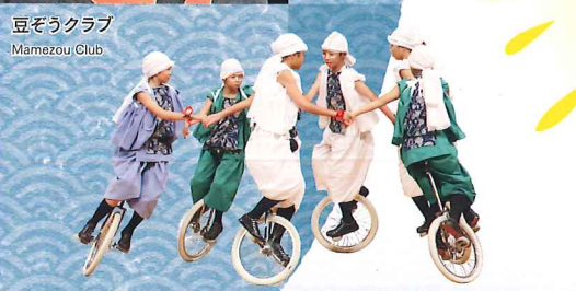
豆ぞうクラブ Mamezou Club